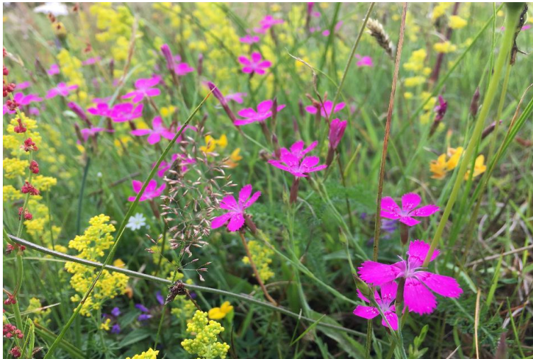
Steevanjer en Geel walstro.

Zoals de steenanjer. Dit jaar dook de soort op een heel andere plek op dan aanvankelijk gezaaid, en deed het daar ondanks de droogte prima.