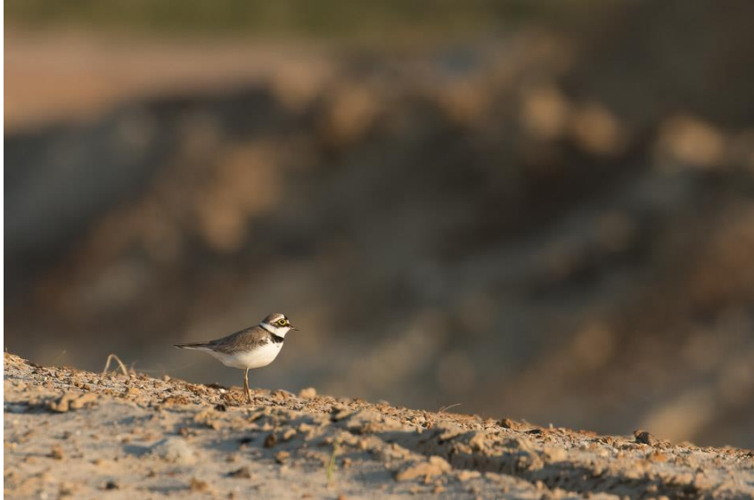
Kleine plevier op de Ommermars

Er is veel waardering voor dit burgerinitiatief dat op initiatief van onze Vereniging in 2014 is gestart.