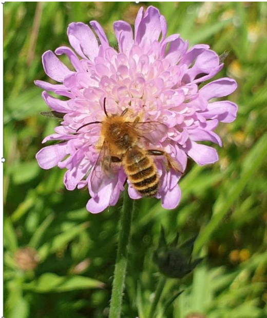
Pluimvoetbij op Beemdkroon. ( Knautia arvensis ) Een uitstekende inheemse insectenplant.

Het is natuurlijk niet alleen een vlindertuin. We proberen het zoveel mogelijk soorten naar 't zin te maken. En het mooie.....: Ze komen vanzelf. Als de omstandigheden maar op orde zijn.