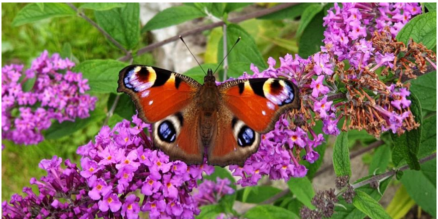
Dagpauwoog op vlinderstruik. (Vergelijk nachtpauwoog eerder in dit verslag)