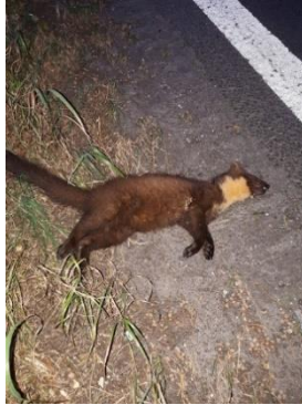
Boomarter (zie de geelachtige keelvlek)