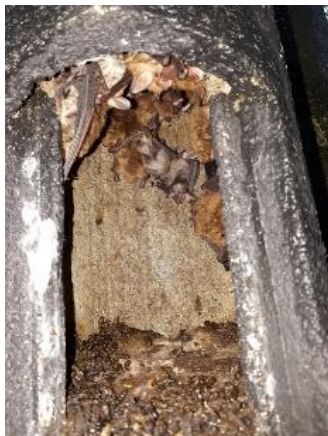
Kast met Rossevleermuizen met jongen (de grijze)